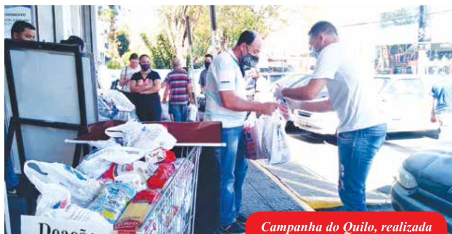
Campanha do Quilo, realizada pelo Grupo de Voluntários Transformação, composto por colaboradores da Romagnole

As campanhas conduzidas pela área de Responsabilidade Social e apoiadas pelo grupo compreendem a arrecadação kits escolares, agasalhos e cobertores e