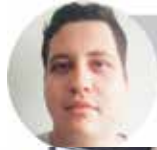
Roberto Junior, da Redação do Jornal Agora